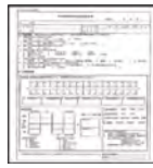
受診票(白色A4) ※健康診査・がん検診等受診券に同封します。