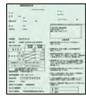
健康診査受診券(A4サイズ)