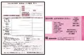
健康診査・がん検診等受診券(ピンク色)