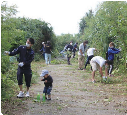
▲親子での参加もありました!