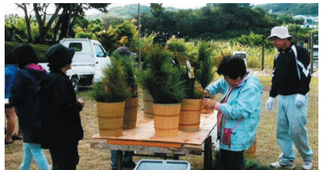
▲12月の門松作りの様子

また、平成18年度からふれあい事業をはじめ、公 民館で塗り絵や、輪投げ、スカットボウル、玉入れ等 を楽しんだり、年3回ほどピクニックにも出かけ、国 頭村の金剛石林山、伊江島のゆり祭りに行きました。 どの行事も自治会役員や区民の皆さんのご協力で実 現できています。これからも、区民のみなさんと一緒 に自治会を盛り上げていきたいと思ひます。