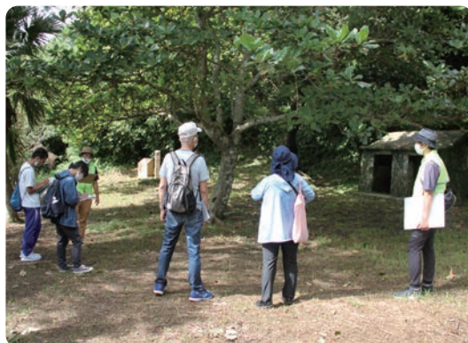
▲日本軍の陣地があった新垣グスク