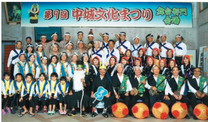
▲第9回中城文化まつり 稲しり節

新垣区は中城村で最も古い集落だと言われてい ます。山手には新垣グスクがあり、その周辺には多くの 拝所があります。また、集落内を通る歴史の道（ハン タ道）はきれいに整備され、すばらしい散策コースと なっています。区の行事としては、敬老会・学事奨励 会、夏祭り、区民運動会、旧盆の綱引き、新春グラウ ンドゴルフ大会があります。区民の皆さんの積極的な 参加や協力でのどの行事も毎年大いに盛り上がってい ます。伝統芸能としては稲しり節があります。古くから 伝わってきた踊りで平成26年の中城文化祭りで総勢 50余名で演舞したこともあります。現在は「稲しり 節保存会」を立ち上げ、その継承に努めています。ま た、村ウバギー（旧暦10月1日）も子供の誕生を祝 い健康を祈願する大切な行事として行われています。 その他にも有志の皆さんで「トゥールバイ保存会」「山 いも会」「門松を作ろう会」などを結成し、地域を盛 り上げようと活動をしています。これからも住んで楽 しいと思える新垣区を目指して地域の皆さんと一緒に なって頑張っていきたいです。