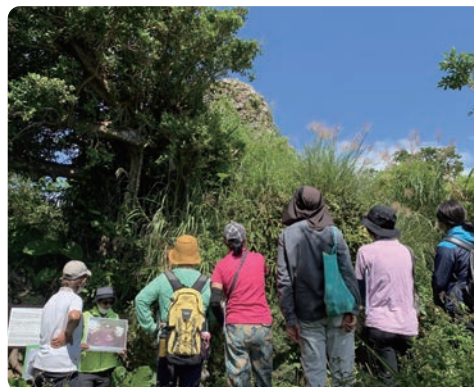
▲161.8高地陣地を見上げる参加者