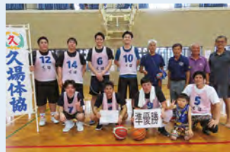
男子準優勝 久場体協