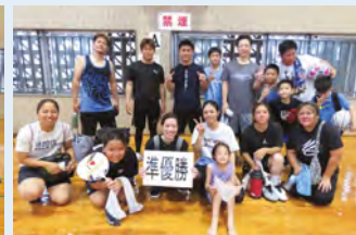
女子準優勝 泊体協