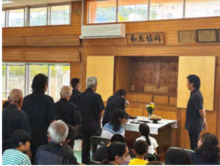
参加者による焼香