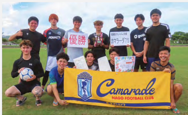
経験者(チューバー)の部