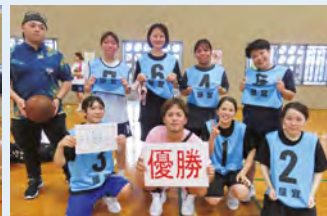
女子優勝 屋宜体協