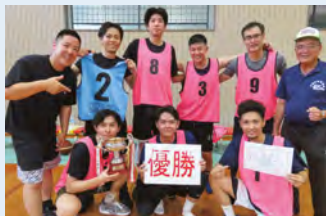
男子優勝 南上原体協

中城村民体育館を会場に各体協から男子9チーム、女子5チームの参加があり、5年ぶりの開催となりました。各チームの選手たちは熱戦を繰り広げ、歓声と声援が絶えませんでした。男子の決勝戦は大接戦のすえ、南上原体協が優勝しました。