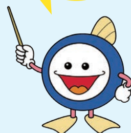
下水道マスコットキャラクター 「スイスイ」