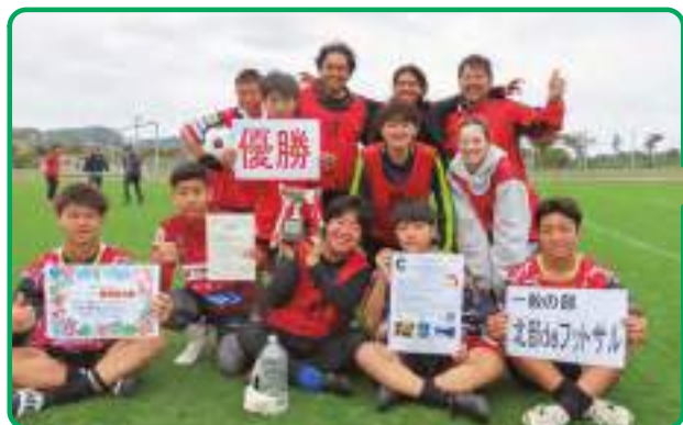
一般の部 北部 de フットサル