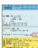
特定健診受診券 (保険証一体型)