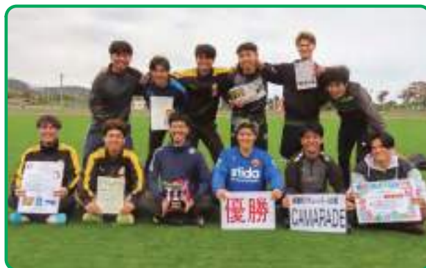
経験者(チューバー)の部 CAMARADE(カマラード)