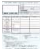
健康診査・がん検診等受診券 (空色)