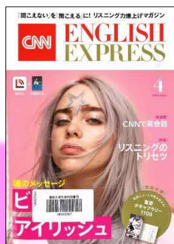
CNN ENGLISH EXPRESS