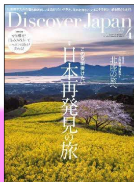
Discover Japan 4月号