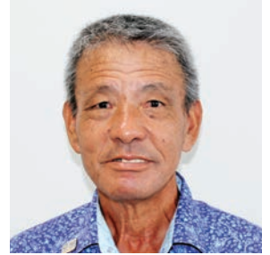
新垣 貞則 議員

新垣氏住宅（久場1919番地）側の排水路は、降雨によって上流からの雨水で生活道路へ氾濫し、区民の通行が困難となったが対策は