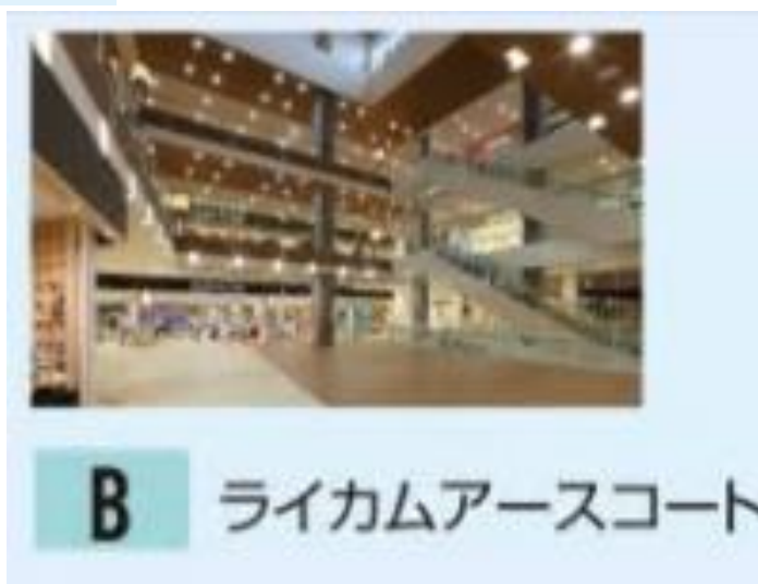
イオンモール沖縄ライカム2階、 ※AEON STYLE（食品館）側のイベントスペース