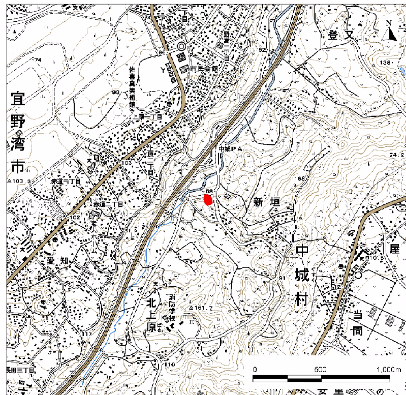
( 1/25,000 )