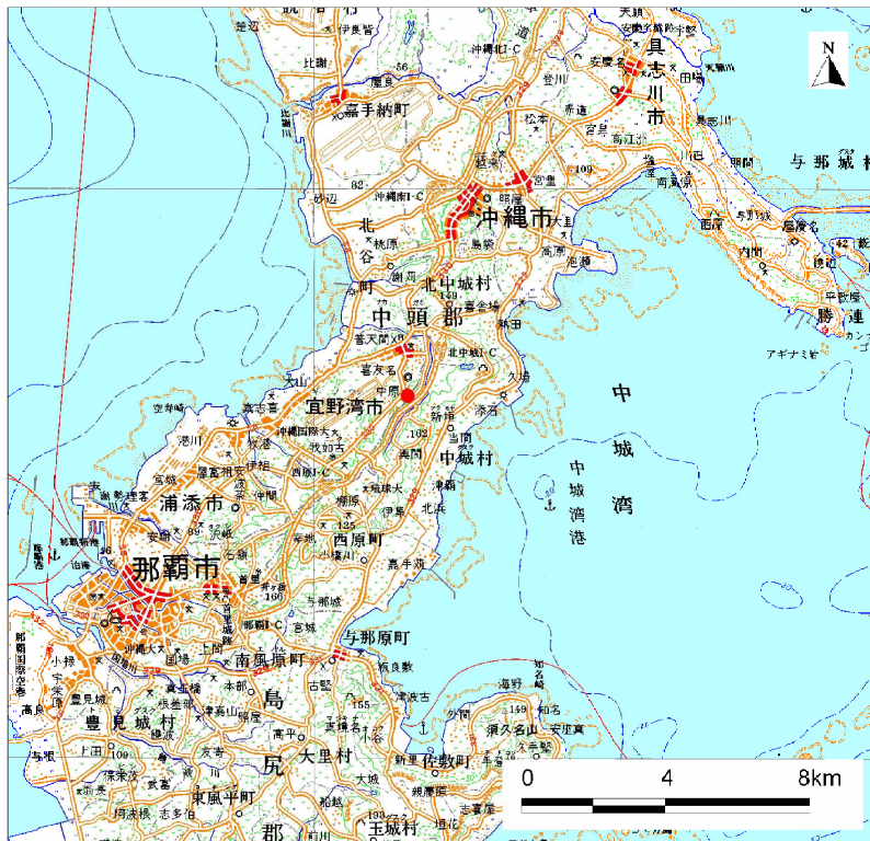
( 1/200,000 )