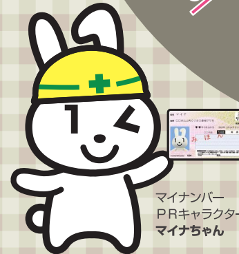
マイナンバーPRキャラクター マイナちゃん