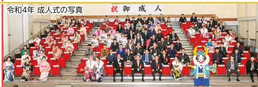
令和4年 成人式の写真

民法改正により、令和4年4月1日から成年年齢が20歳から18歳に引き下げられましたが、中城村では、今年度は令和4年度に20歳を迎える方を対象として、下記の日程で式典を開催いたします。