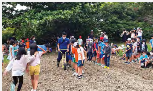
島にんじん植えの栽培体験