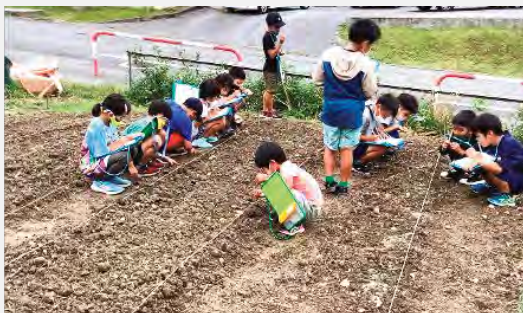
島ヤサイ学習の様子