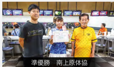
準優勝 南上原体協