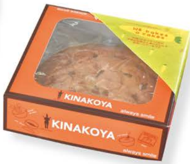
▲商品名:We bakes a cakes 販売店:きなこや(中城村字泊96番地)