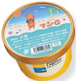
▲商品名:マンGアイス 販売店:那覇空港国際線ビル3階スノーラゲーンアイスクリーム

中城中学校の生徒が村の特産品を活用した商品開発に取り組み、開発した4商品のうち、マンゴーアイスと島にんじんケーキの一般販売が4月から始まりました。生徒達の想いや頑張りが詰まったこの商品を、ぜひ一度お召し上がりください。商品の売り上げの一部は、中城村商工会を通して村の教育資金へ寄付されます。