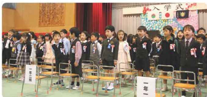
▲新入生による歌「一年生になったら」♪