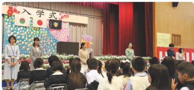
▲クラス担任紹介のようす