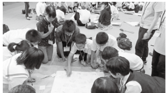
▲「青少年ピースフォーラム」での様子

長崎市主催の「青少年ピースフォーラム」へ参加し、全国から集う派遣者と意見交換しながら、被爆の実相を知り平和について理解を深めました。