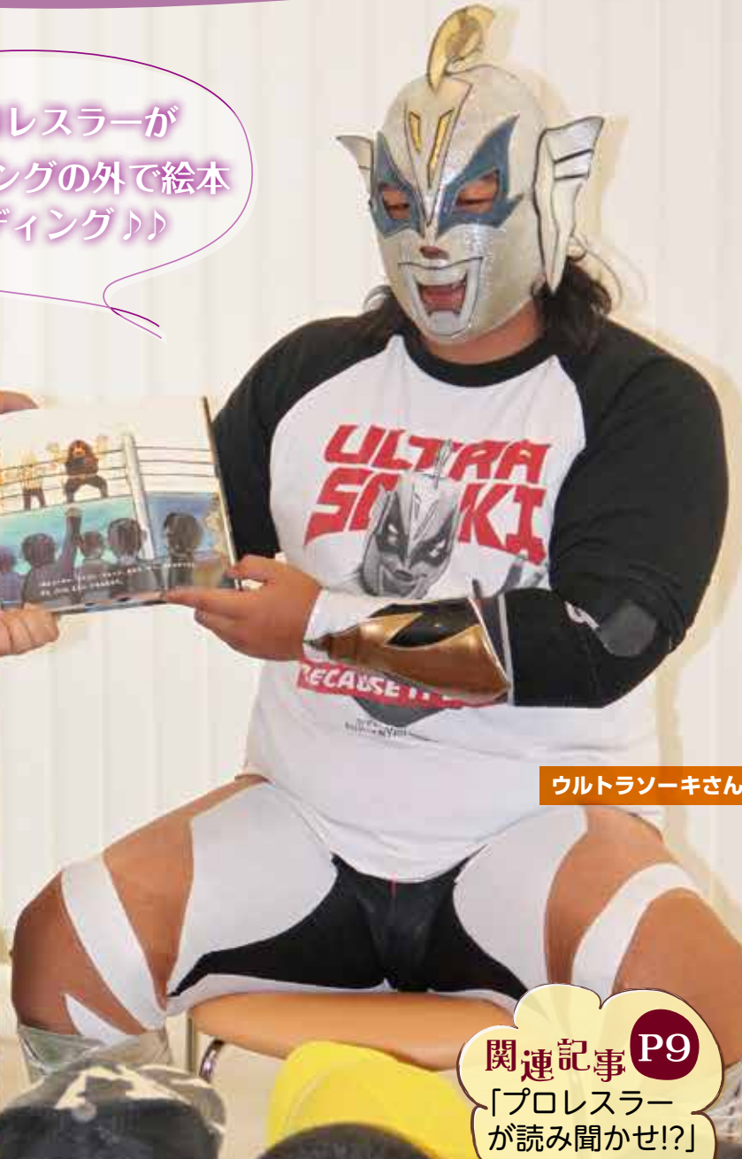
ウルトラソーキさん