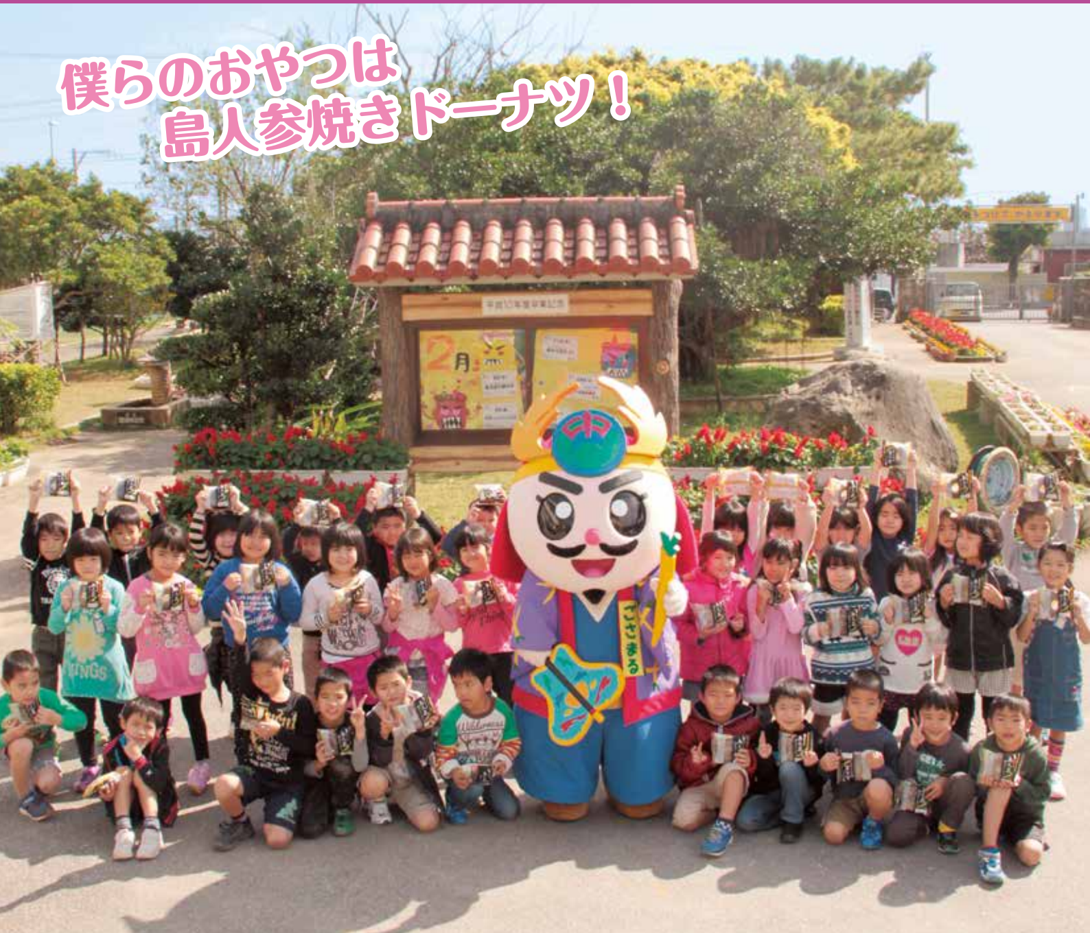
「護佐丸の島人参焼きドーナツ」の再販が決定! (関連記事 P4) 撮影協力: 津覇小学校 1年生の皆さん