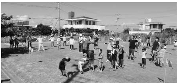
▲世代交流として区民スポーツ大会があります。