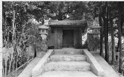
伊舎堂にある「倶楽部のウカミヤ」(写真2)

詳しい年代や理由は分かっていませんが、言い伝えによると約四百六十年ほど前に伊舎堂は古島から現在の場所に集落を移動し、公民館敷地内にタウンをウンチケー（お迎え）したと伝えられています（写真2）。そのウンチケーしたタウンを地元の人々は「倶楽部のウカミヤ」と呼ぶようになりました。このように呼ぶのは、昔、公民館のことを「倶楽部」と呼んでいたためだと考えられます。古島にあったタウンは現在集落では拝まれておらず、戦前の時点ですでに倶楽部のウカミヤだけを拝むようになっていたようです。現在も自治会長さんを中心として、ハチウビー・ムラウガン・クングワチクニチ〈註3〉の際には倶楽部のウカミヤを拝んでいます。