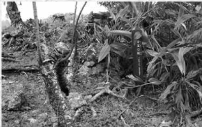
中城城跡にある「伊舎堂の殿」(写真1)

現在の伊舎堂は、国道329号線を挟んで東部の平坦地に集落を成していますが、もとは中城城跡の管理事務所付近に集落があったと言われています。このような、かつて集落のあった場所を「古島」と言います。さらに、伊舎堂のタウンも、もとは古島周辺にあったと伝えられており、現在でも「伊舎堂の殿」と書かれた表柱でその場所を確認することができます（写真1）。