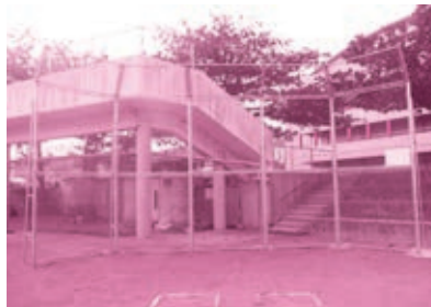
▲中城小学校バックネット設置事業