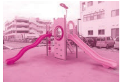
▲中城南小学校遊具設置事業