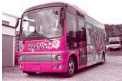
◀中城村コミュニティバス購入事業