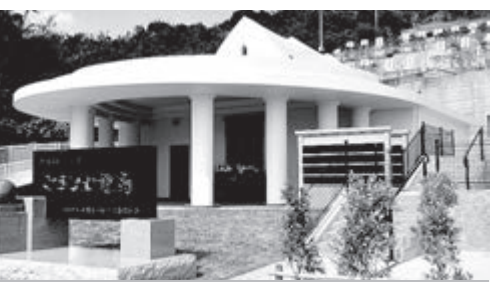
園内にある永代供養墓・納骨堂「おきなわ霊廟」