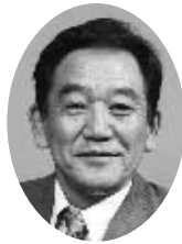
副議長(総務委員) 宮城 治邦