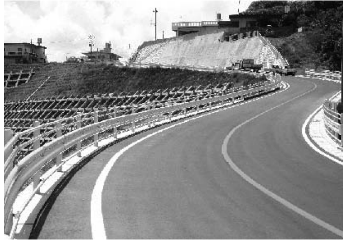
▲供用を開始した村道坂田線の現在の様子

平成18年6月10日の土砂災害から2年が経過し、一部通行止めとなっていた中城村北上原の村道坂田線が8月1日より供用を再開しています。