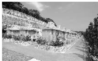
【園内全バリアフリー】高齢者や車いすの方でも安心に園内は全バリアフリーを採用しています。