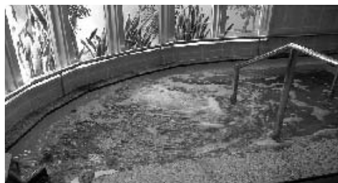
【準天然温泉設備】（厚生労働省認可）

全身マッサージが可能なリクライニング式マッサージチェアを5台完備。お好きな時間に自由にご利用できます。