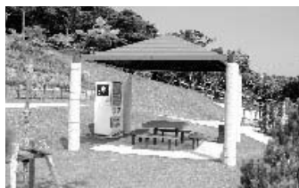
【東 屋】園内各所に景色を一望できる休息所を設けています。ご自由にご利用ください。