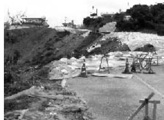
▲平成18年被災直後の村道