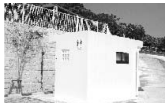
【お手洗い】管理の行き届いた清潔なお手洗いを園内に数箇所設置。