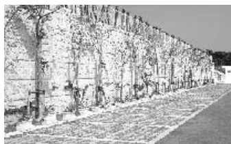
【駐車場】清明祭などの混み合う時期などにも、ゆとりをもってご利用できます。