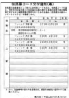
住民票コードの通知例

住民票コードは、子どもから大人までの全ての人に設定されるコード（11桁の数字）で、全国共通で重複しないようになっています。住民票コードは、8月5日以降に全国一斉に住所地の市区町村から通知されます。 今後、行政機関（国・県等）への届出、申請の際に求められることがありますので、大切に保管してください。