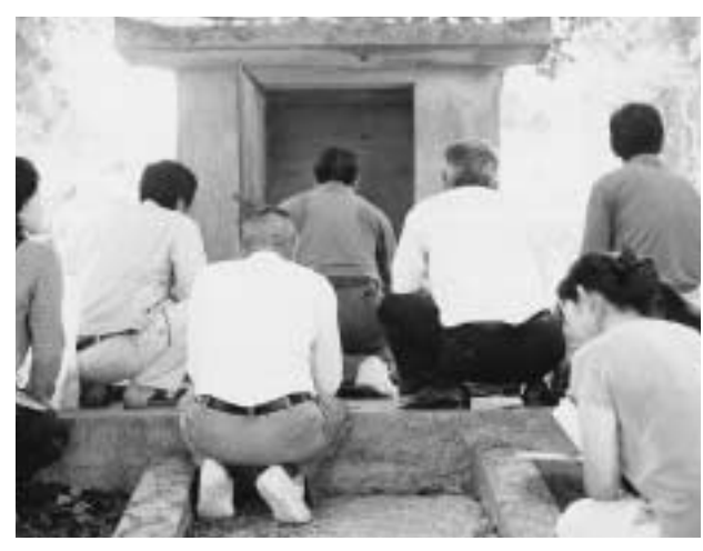
5月26日、屋宜のウマチー。玉城殿にて拝む。

十四日の夜はエーグムイ（夜籠もり） ③ といって奥間にノロさん呼ばれて。ジュエーシ ④ とたくさん作ってみんなにあげよったから若い人は