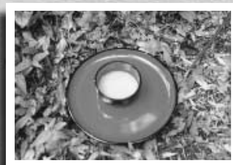
6月26日 新垣にて（ウヌサクの代用品 ヨーグルト）

六月二十六日のウマチーには根家、玉城之殿、東殿、与那嶺家（屋号玉城）、地頭殿ノロ殿内にて、ビンシーと米を携えた十人余が祈願した。また、泊では大正頃まで添石ノロが拝みに来ていたといわれる。ウヌサクは昭和三十九年頃まで作っていたといふ。現在村落単位のウマチーはなく、門中単位で行っている。あるムートウヤ ⑧ に嫁いだ女性（昭和六年生）によれば、「十四日は神様が降りてくる日だから夕飯とお供えする。十四日から針仕事をやってたらいけない、肥やしを担いで畑に行つてはいけない、トイレもちゃんときれいにしておく。十六日までは絶対あん守りなさいよ」と隣のおばあさんが教えよったわけ」。