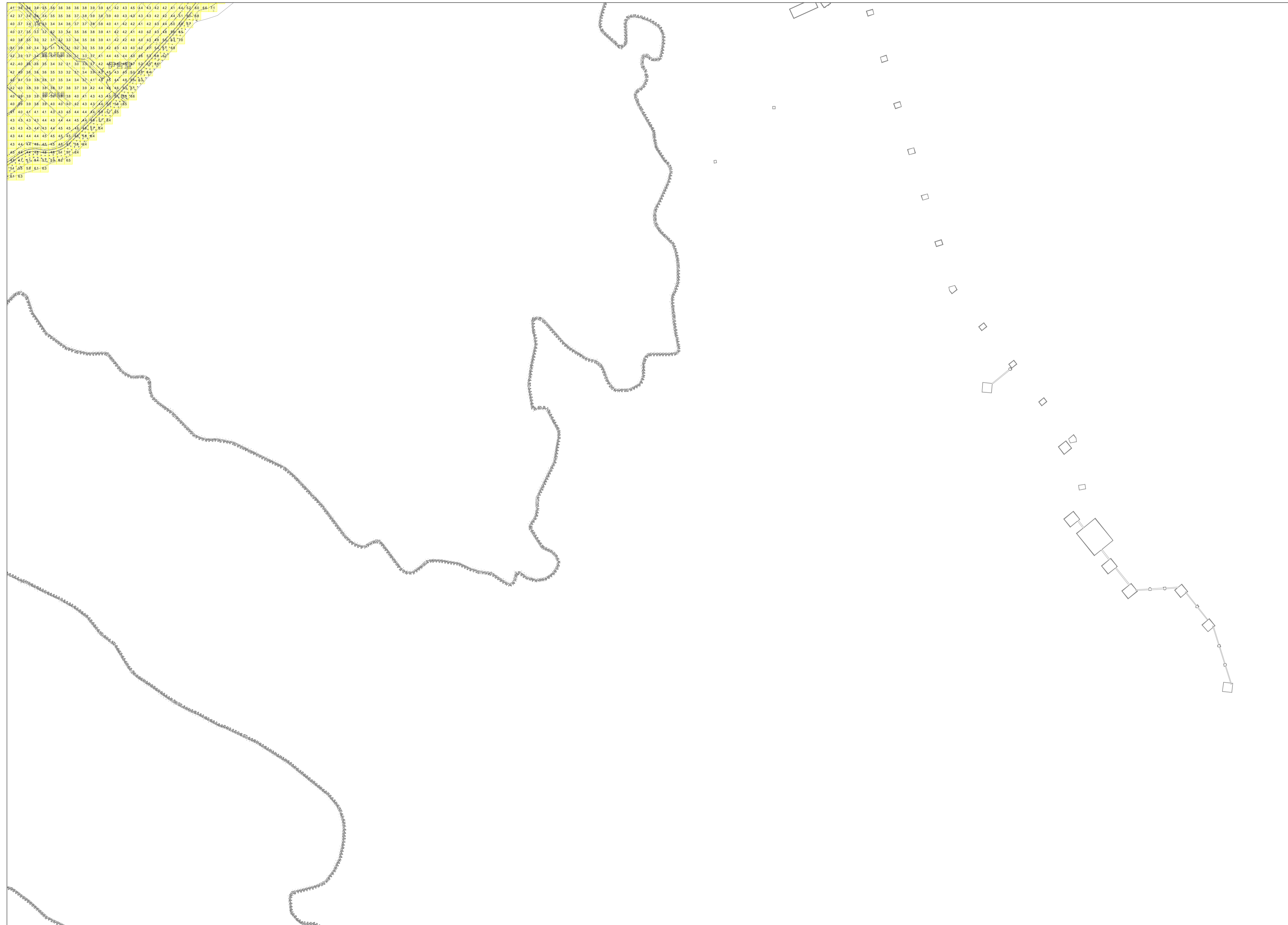
この地図は、沖縄県数値地形図を使用したものである。(平28企情第334号)