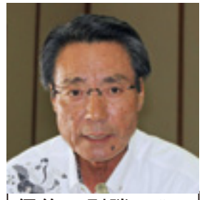
伊佐 則勝 議員

議員 東京都の健康長寿センターの資料からウォーキングを1日30分(40分歩いたら脳の海馬が2%アップし学習能力が向上した。認知症予防、糖尿病予防の効果があるとされています。元氣な高齢社会を構築するために老人クラブを増やす考えはないですか。