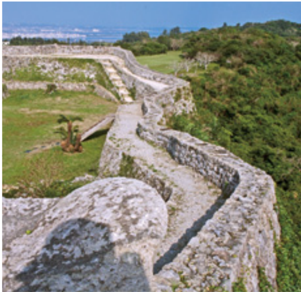
▲入りやすい環境と中城城跡の魅力作りが入客数増加へ繋がる