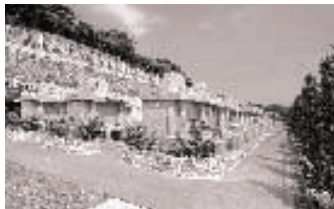
【園内全バリアフリー】高齢者や車いすの方でも安心に園内は全バリアフリーを採用しています。