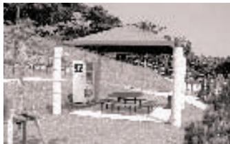
【東 屋】園内各所に景色を一望できる休息所を設けています。ご自由にご利用ください。