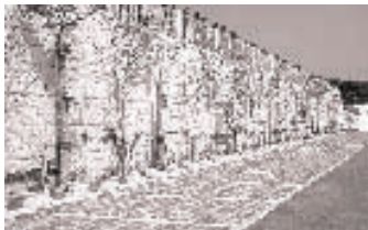
【駐車場】清明祭などの混み合う時期などにも、ゆとりをもってご利用できます。