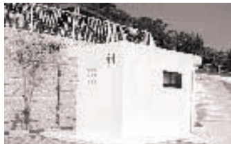
【お手洗い】管理の行き届いた清潔なお手洗いを園内に数箇所設置。